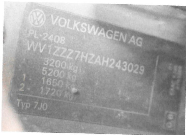
Fot.1 Tabliczka znamionowa samochodu