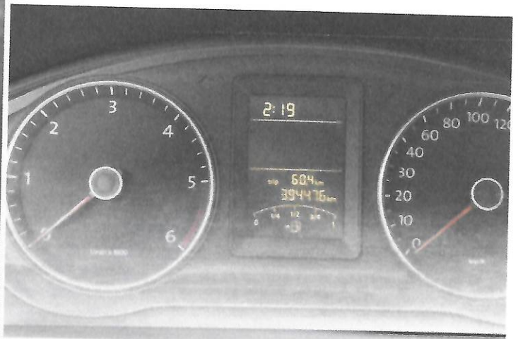
Fot.2 Wskazania drogomierza