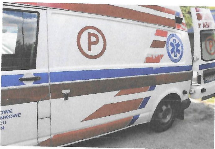
Fot.7 Widok tylnej części lewego boku