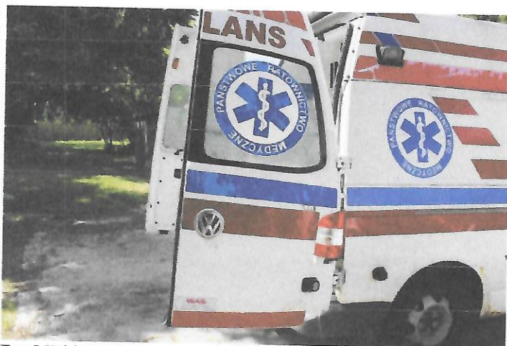
Fot.5 Widok tyłu i prawego boku