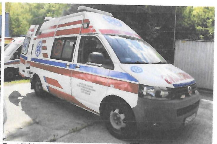
Fot.4 Widok przodu i prawego boku