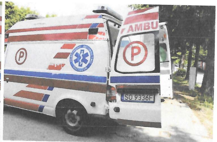
Fot.6 Widok tyłu i lewego boku