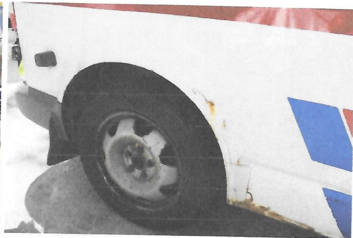
Fot.8 Widok tylnej części prawego boku