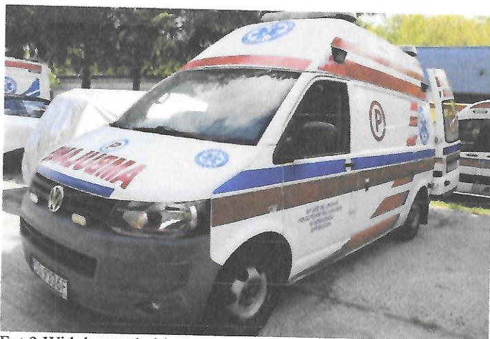
Fot.3 Widok przodu i lewego boku