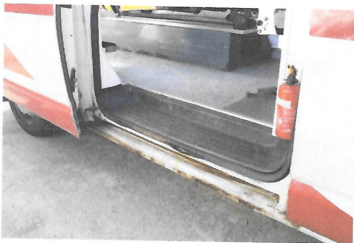
Fot.9 Widok wnętrza drzwi przesuwanych prawego boku