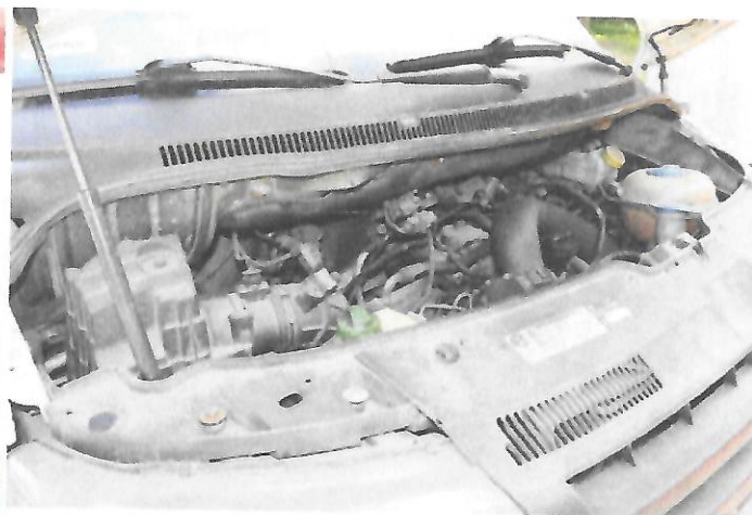
Fot.10 Widok komory silnika