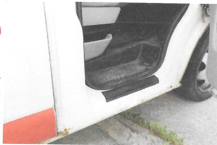
Fot.12 Widok wnętrza drzwi przednich prawych