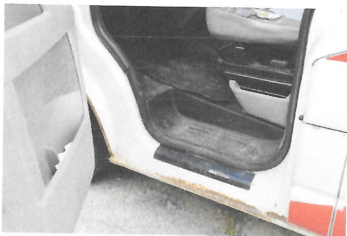
Fot.11 Widok wnętrza drzwi przednich lewych