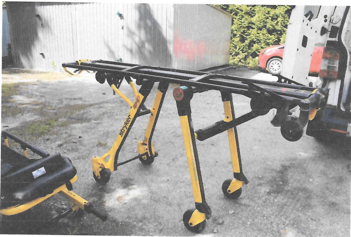
Fot.2 Transporter noszy