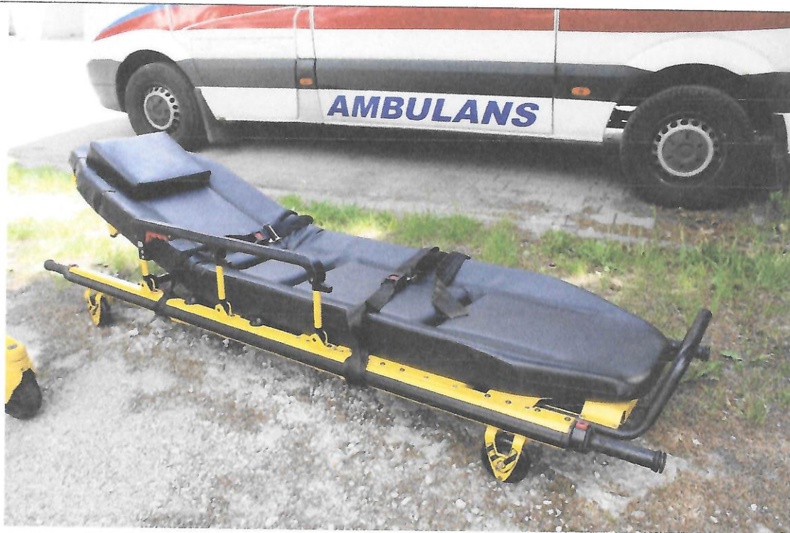
Fot.5 Nosze główne