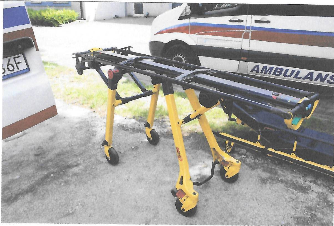
Fot.3 Transporter noszy