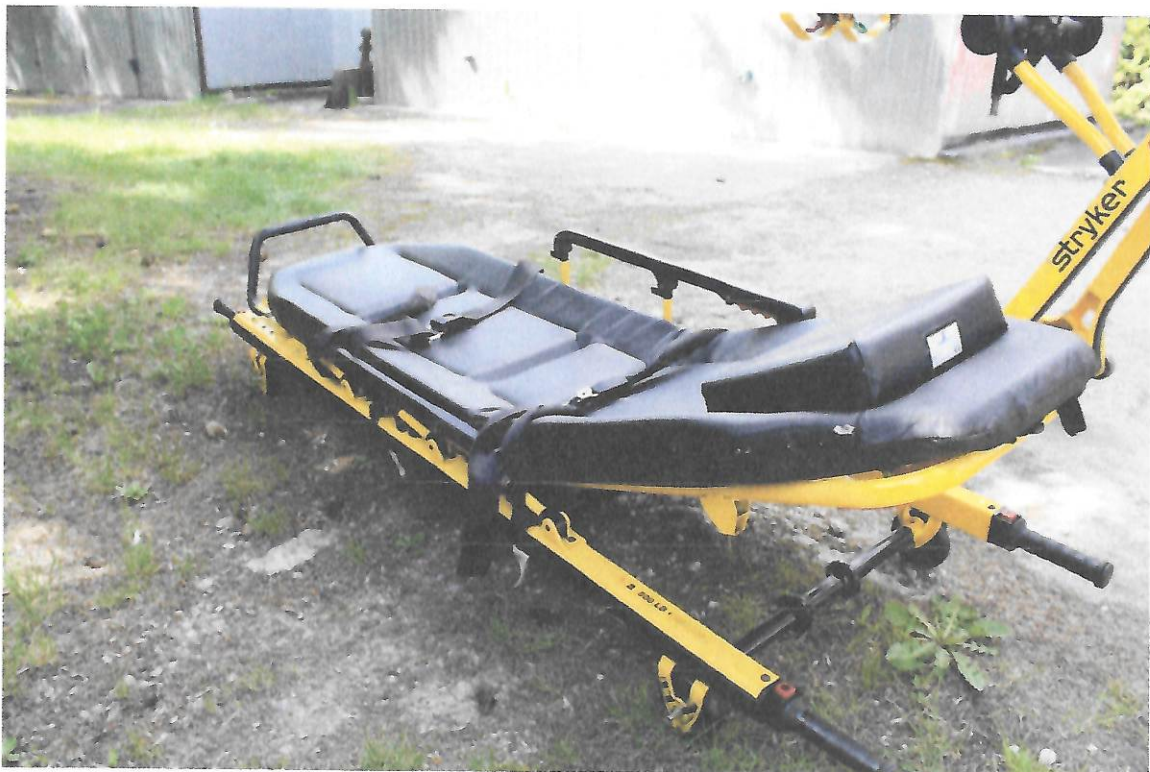
Fot.4 Nosze główne