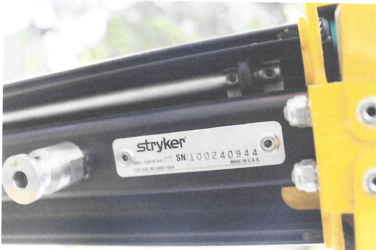
Fot.8 Tabliczka znamionowa transportera noszy