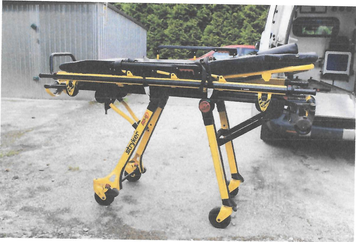
Fot.1 Nosze kpl.

Fot.2,3 pokazano transporter noszy, a na Fot.4,5 - nosze główne po demontażu. Na Fot.6 pokazano nalepkę księgową umieszczoną na noszach głównych, a na Fot.7 – ich tabliczkę znamionową. Na Fot.8 pokazano tabliczkę znamionową transportera.