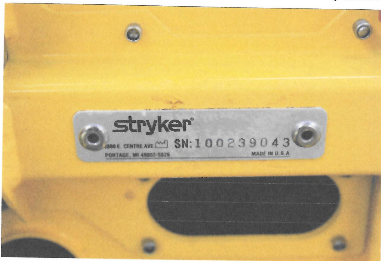
Fot.7 Tabliczka znamionowa noszy głównych