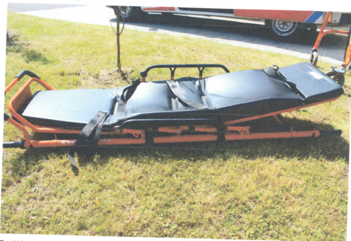
Fot.4 Nosze główne