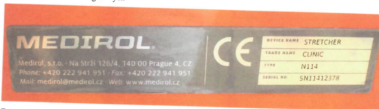
Fot.6 Tabliczka znamionowa noszy głównych

W wyniku oględzin urządzenia stwierdzono, że nosze główne i transporter noszy są normalnie zużyte eksploatacyjnie, z uszkodzeniami typu otarciowego, bez uszkodzeń mechanicznych części nośnych, napędów śrubowych i siłowników hydraulicznych. Wykładzina tapicerska materaca noszy jest podarta.