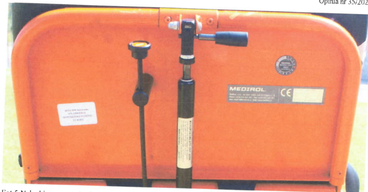
Fot.5 Nalepki na noszach głównych