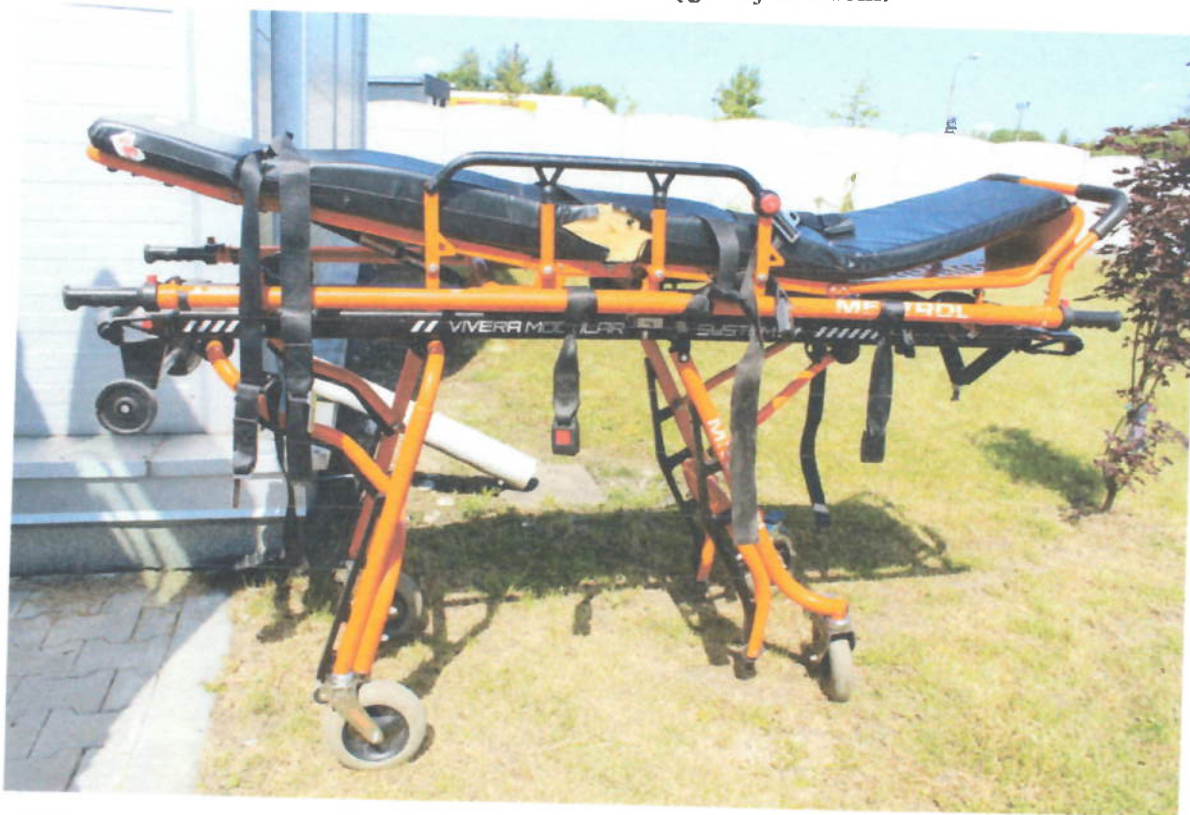
Fot. 1 Nosze kpl.

Fot.4 - nosze główne po demontażu. Na Fot.5 pokazano nalepki umieszczone na noszach głównych, a na Fot.6 – tabliczkę znamionową noszy głównych. Na urządzeniu brak jest tabliczki znamionowej transportera oraz nalepki księgowej z kodem.