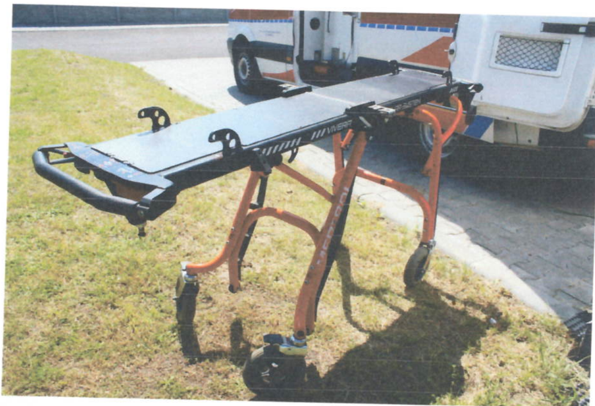
Fot.2 Transporter noszy