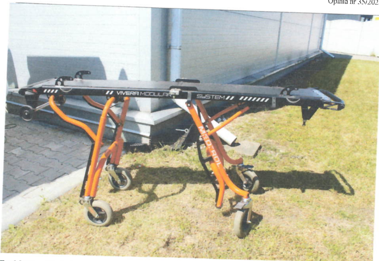
Fot.3 Transporter noszy